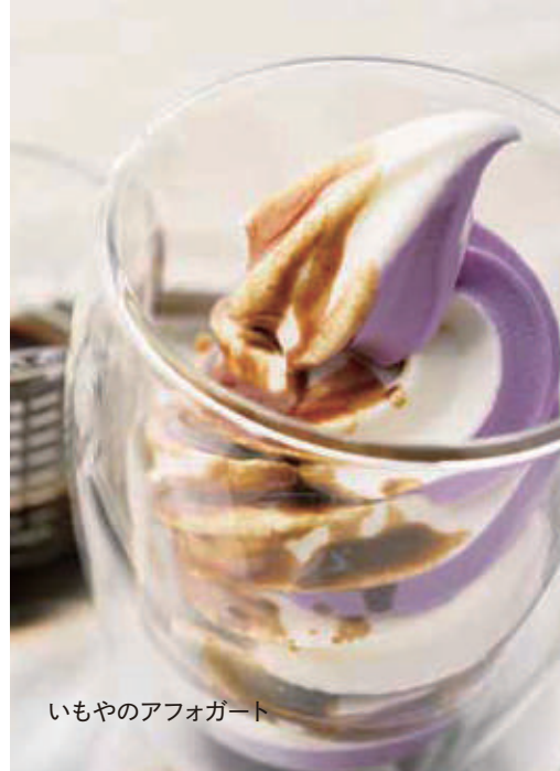
いもやのアフォガート