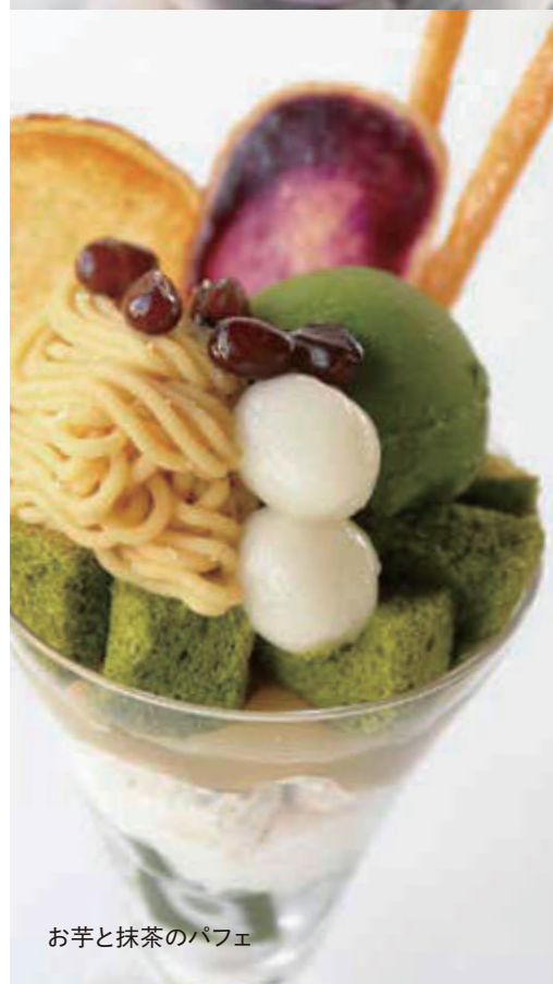
お芋と抹茶のパフェ