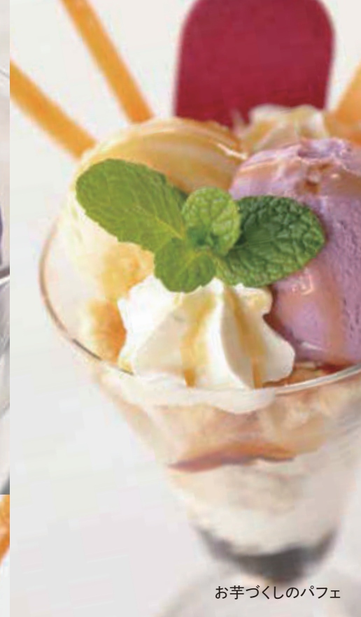
お芋づくしのパフェ