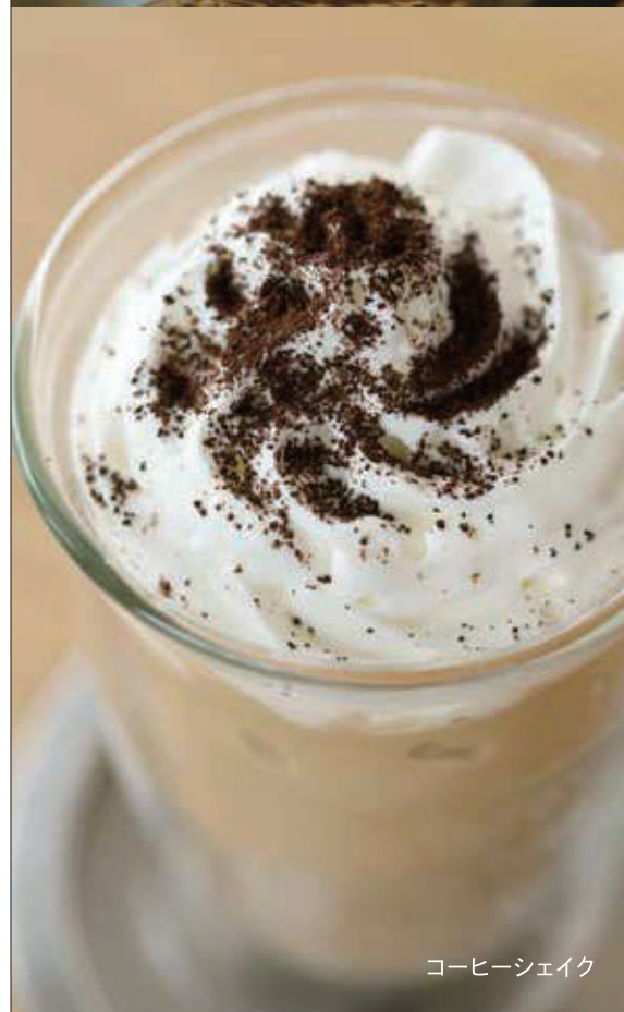
コーヒーシェイク